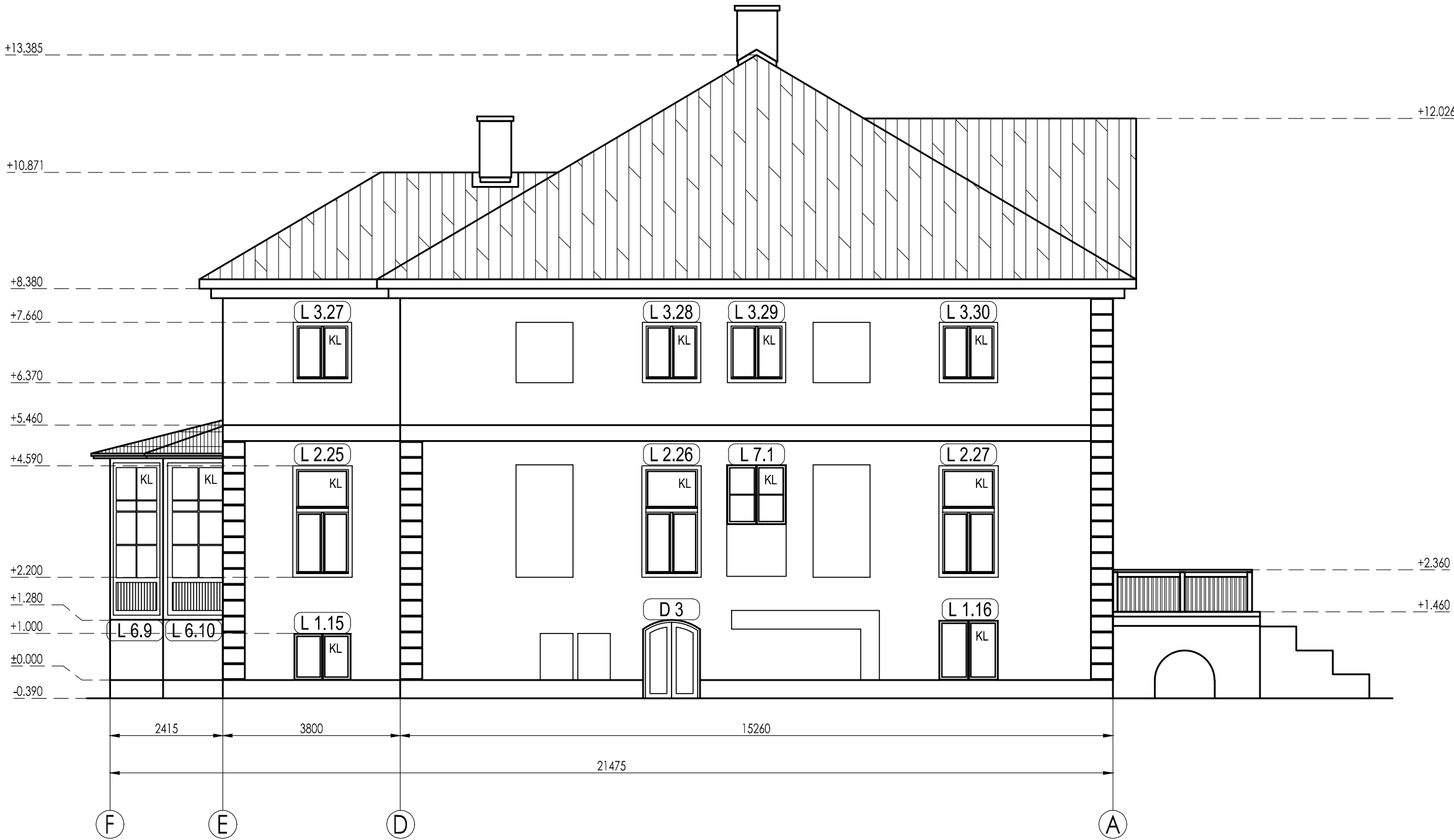
Ēkas projektētā situācija. Fasāde asīs F-A; M 1:100